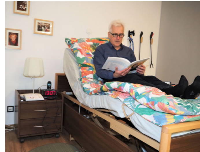
Relaxen oder Pflegen Bequeme Lösungen kombiniert mit praktischer Hilfe