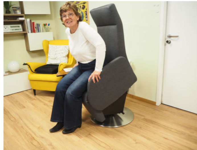
Runter von der Couch Aktives Sitzen und leichteres Aufstehen