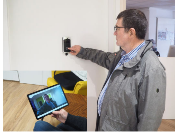
Sich sicher fühlen Sehen, wer vor der Tür steht