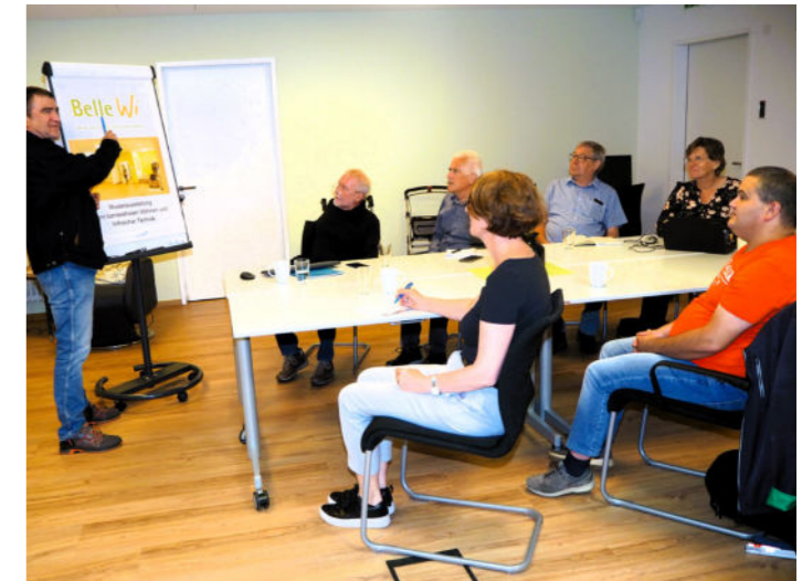
Dazulernen... Fortbildungen für interessierte Gruppen und für uns