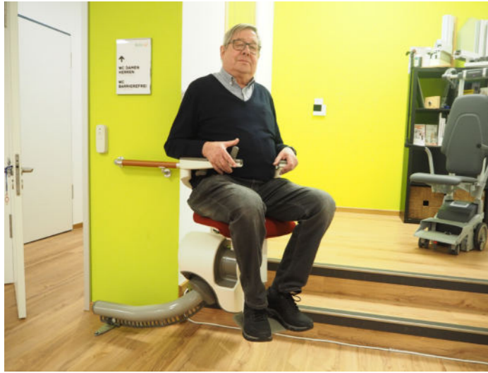
Treppauf - Treppab Stufen sicher und bequem nutzen