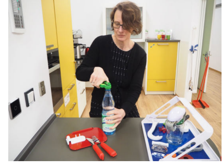
Das bisschen Haushalt... Alltagshilfen und ergonomische Küchengestaltung