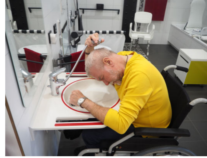
Ein Bad für alle Generationen Vom unterfahrbaren Waschtisch bis zur bodengleichen Dusche