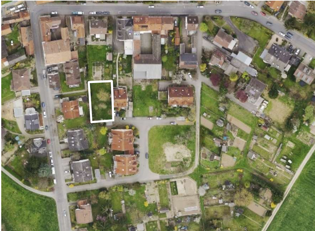
Luftbild (März 2014)