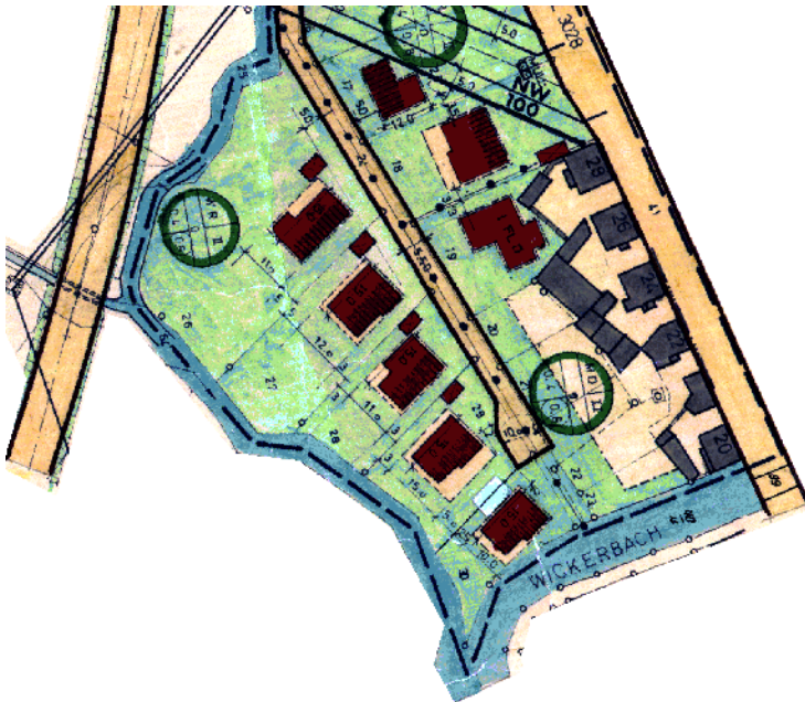
Ausschnitt aus dem Bebauungsplan

Erstellt: Stadtplanungsamt Gustav-Stresemann-Ring 15 65189 Wiesbaden stadtentwicklung@wiesbaden.de