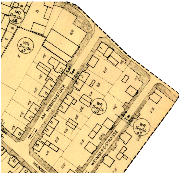
Ausschnitt aus dem Bebauungsplan

Erstellt: Stadtplanungsamt Gustav-Stresemann-Ring 15 65189 Wiesbaden stadtentwicklung@wiesbaden.de