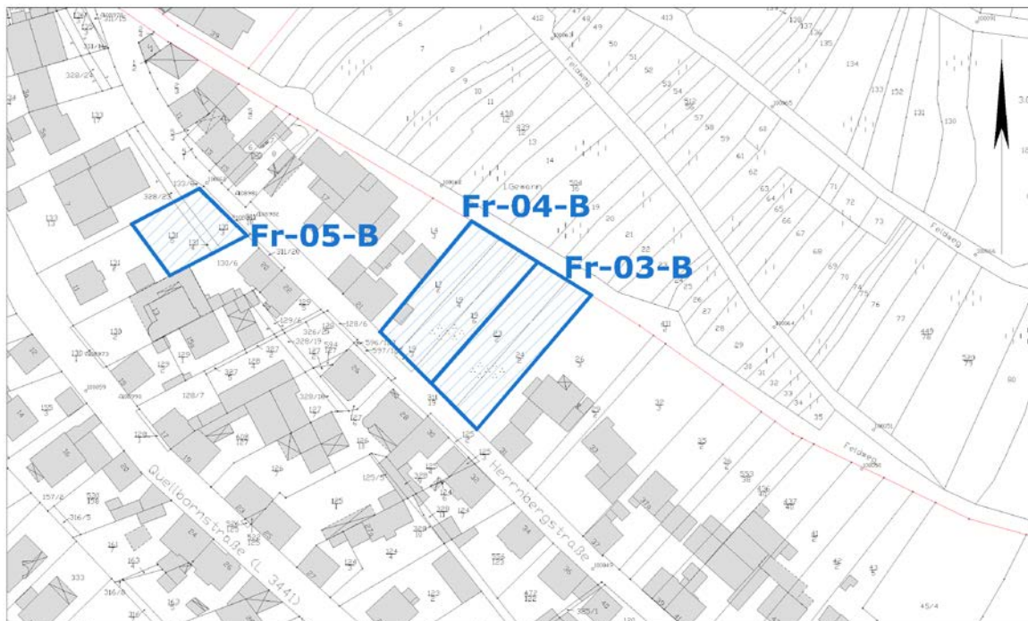
Ausschnitt aus der Stadtgrundkarte