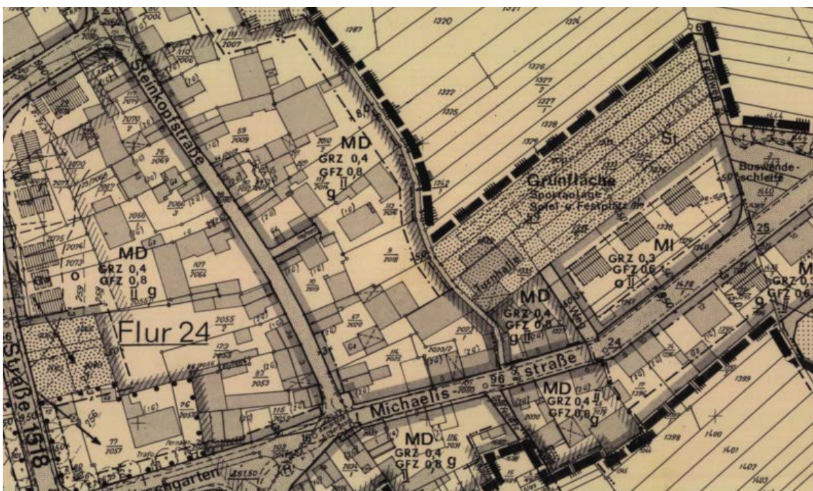
Ausschnitt aus dem Bebauungsplan

Erstellt: Stadtplanungsamt Gustav-Stresemann-Ring 15 65189 Wiesbaden stadtplanung@wiesbaden.de