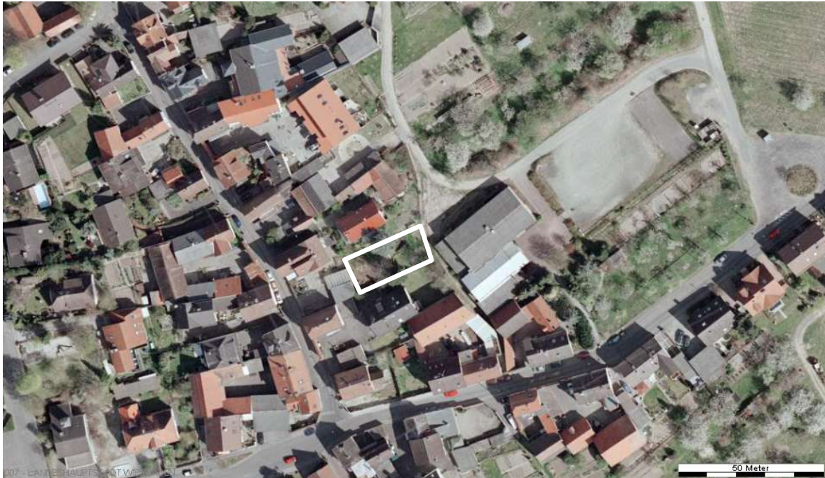
Luftbild (April 2003)