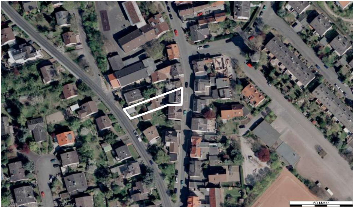
Luftbild (April 2003)