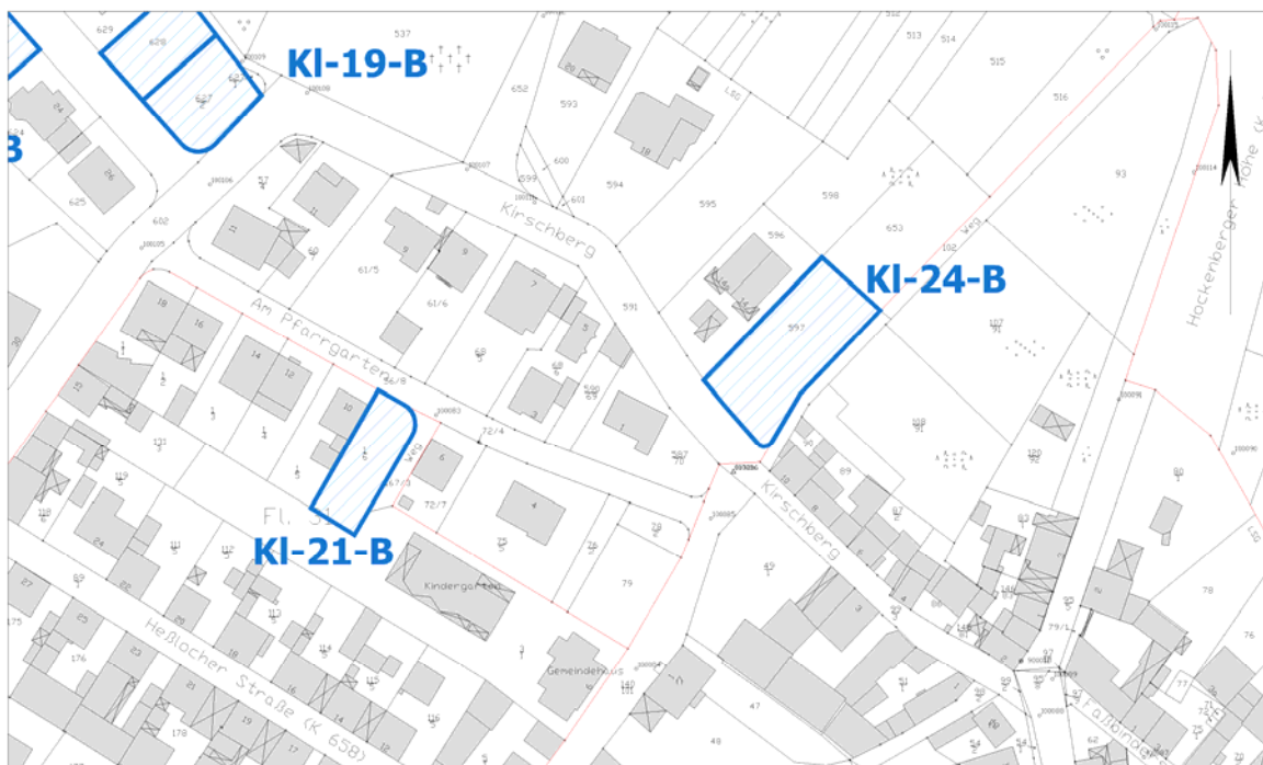
Ausschnitt aus der Stadtgrundkarte