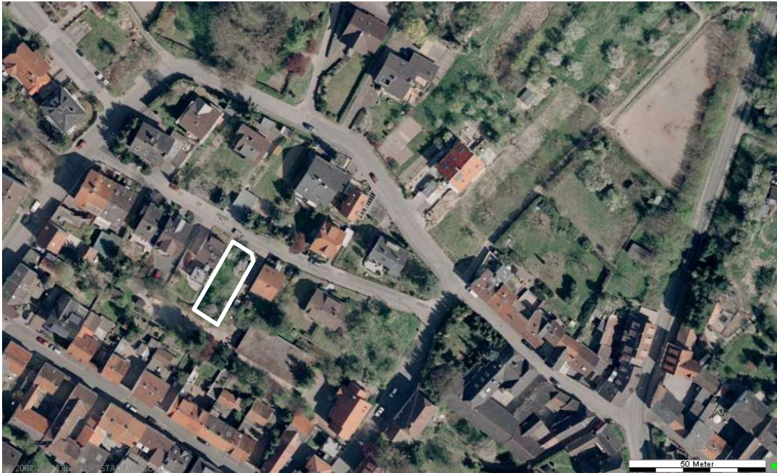
Luftbild (April 2003)