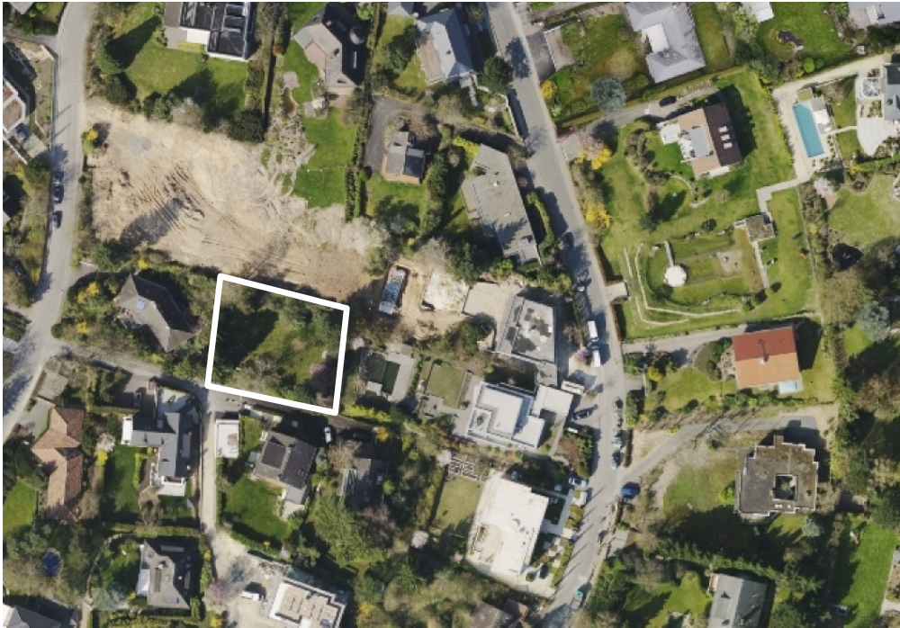
Luftbild (März 2014)