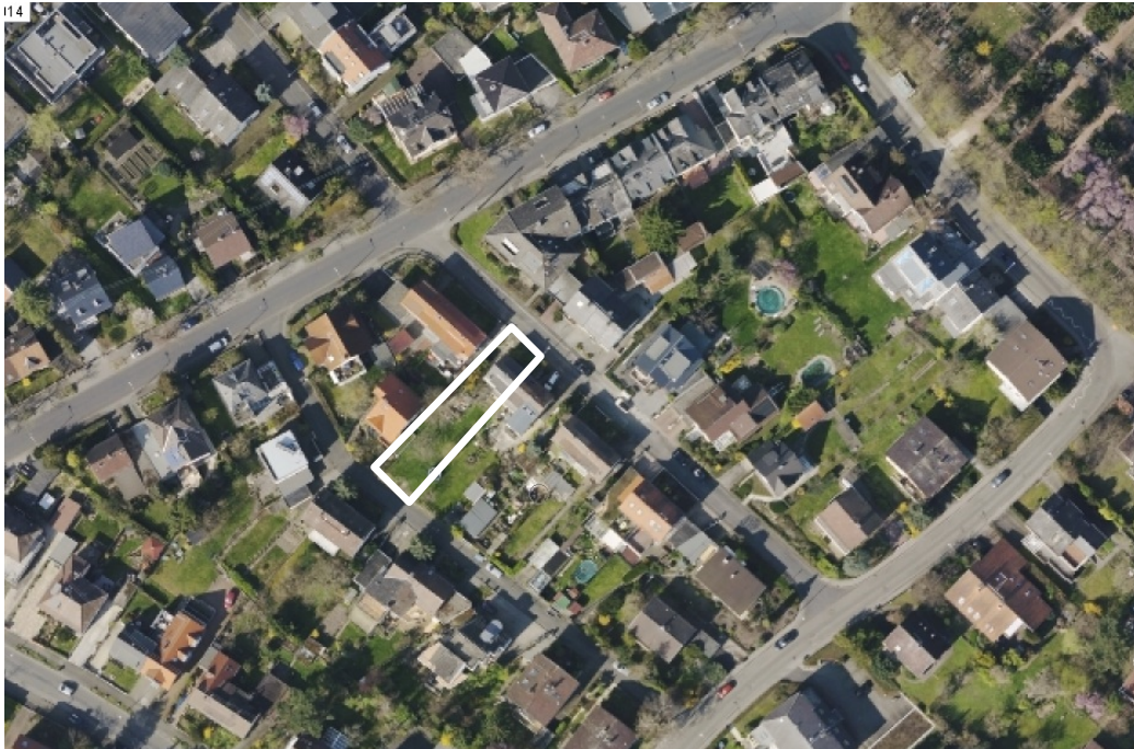
Luftbild (März 2014)