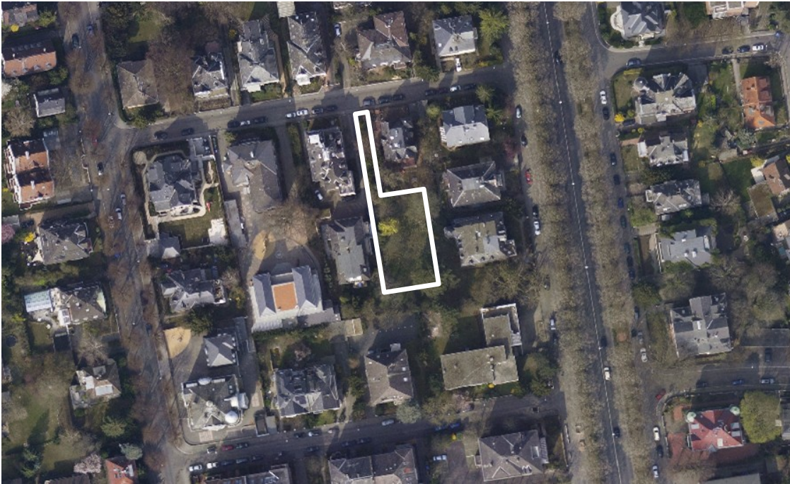
Luftbild (März 2011)