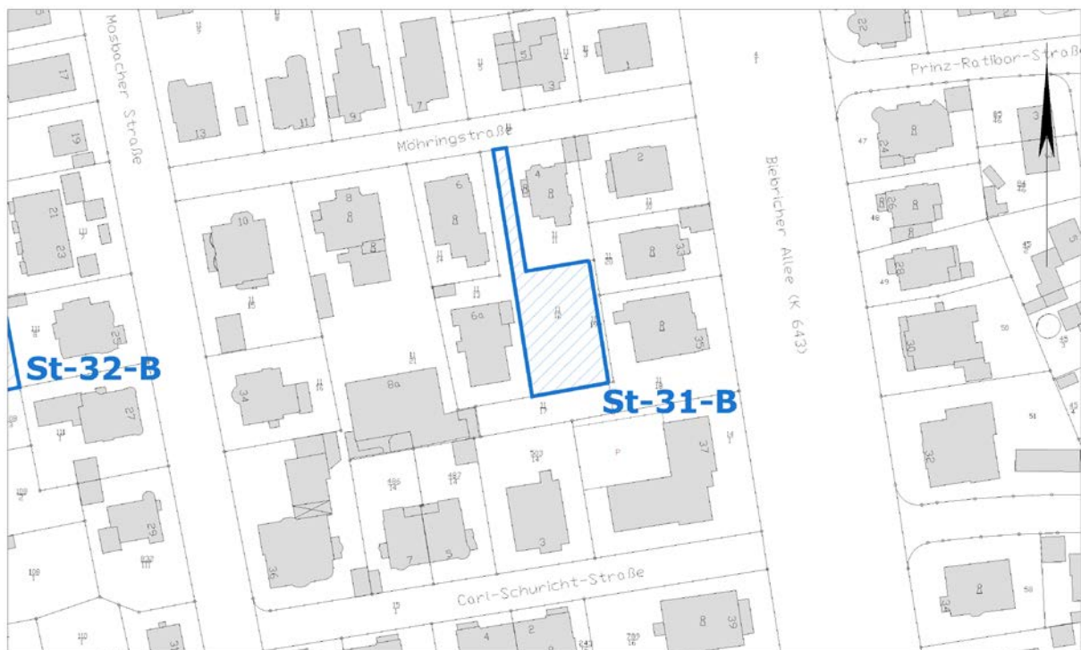
Ausschnitt aus der Stadtgrundkarte

Anmerkungen: Denkmalschutz (Gesamtanlage) und angrenzend Denkmalschutz (Kulturdenkmal, Umgebungsschutz gemäß § 16 (2) HDSchG)